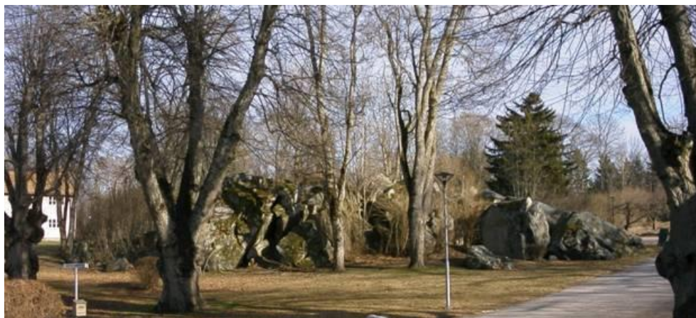
Stenblocken från norr