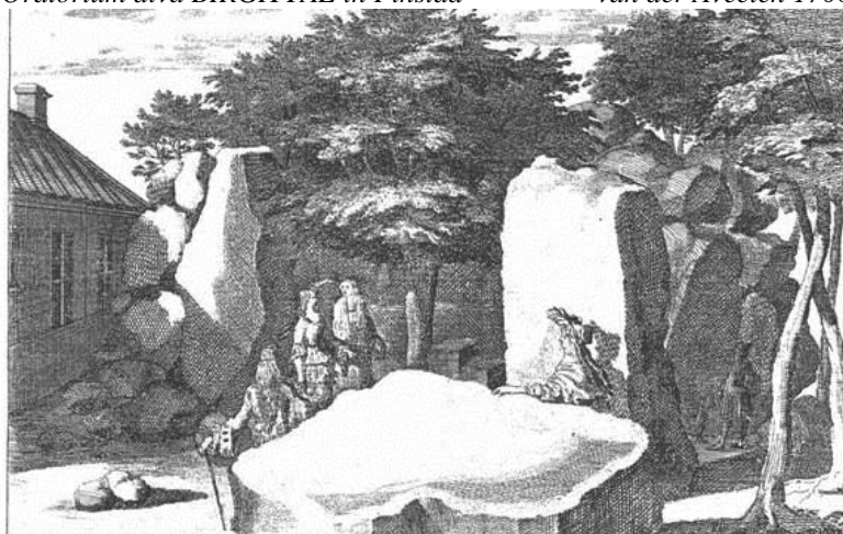
Den gudomliga Birgittas böneställe i Finsta