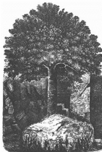
S:t Britas Bönkapell

stensättningar, och i ett närbeläget berg de grottor, i hvilka Brita skall hafva övat sin andakt och mottagit sina uppenbarelser. .... Bland flera fördjupningar i berget är äfven en som kallas S:t Britas Bönkapell. Detta hafva vi genom vår illustration sökt återgifva.”