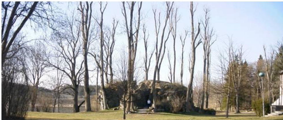
Flyttblocket från söder

Westerling förlägger alltså både ”Bönestället” och ”Kapellet” till flyttblocket. Han nämner också att stenblocken 60 – 70 alnar därifrån bildar ”inom sig en mängd små grottor”. Men han förknippar dem inte med St Brita.