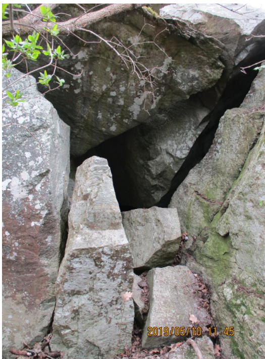
Den blockfyllda skrevan

Dessa bägge åtgärder torde ha vidtagits för att utplåna spåren av/till den ursprungliga grottan.