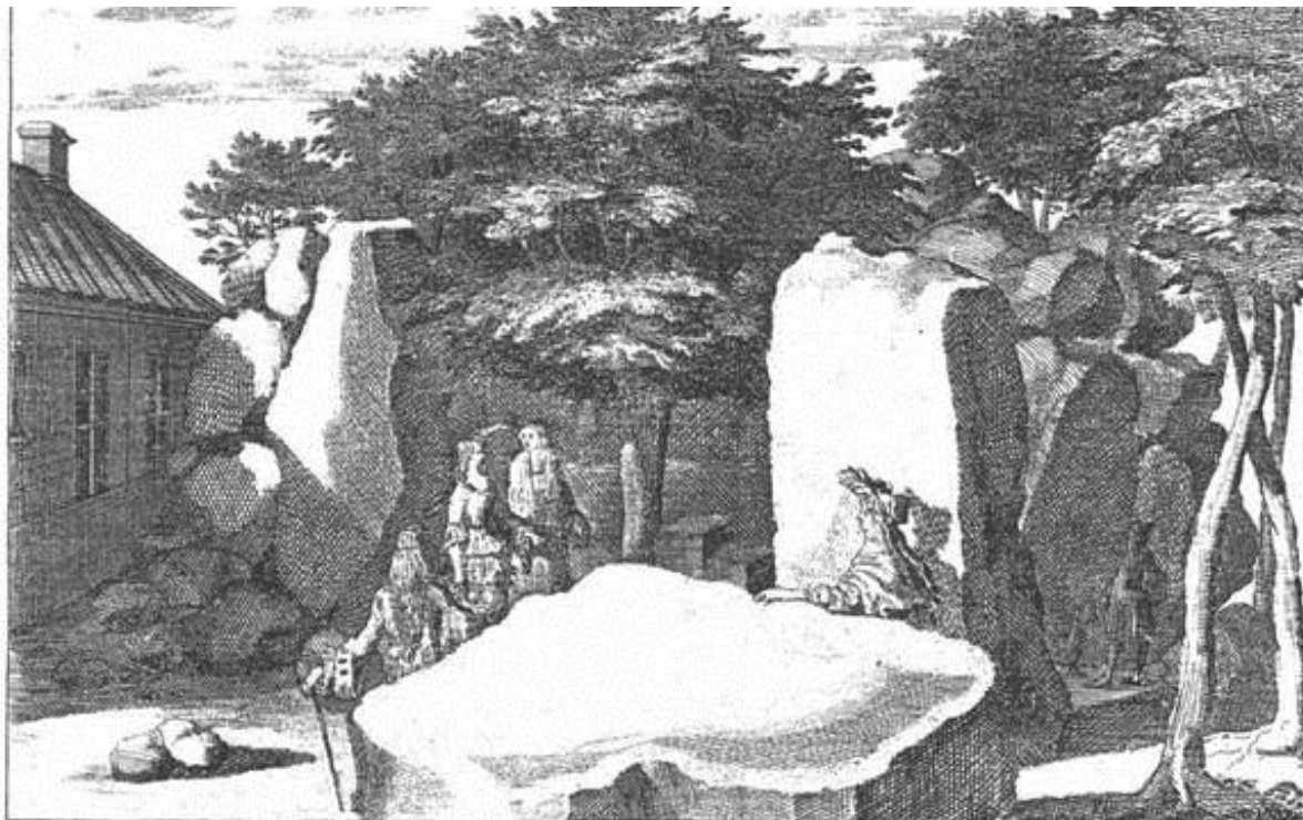
Oratorium diva BIRGITTAE in Finstad ingår i "Dahlbergs Suecia" "Den gudomliga Birgittas böneställe i Finstad"