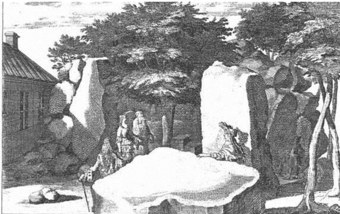
Oratorium diva BIRGITTAE in Finstad ”Den gudomliga Birgittas böneställe i Finstad”

”I dag visas egendomligt nog S:ta Birgittas grotta på annan plats än där hon förut af ålder anvisats och i Dahlbergs Suecia avbildats. Nu visades den i en trång bergsspricka ( i Flyttblocket ) der lämningar av murverk dels sitter i vägg och dels i nedfallna klumpar. Den andra mycket rymligare grottan ( i Stenblocken ) har omsorgsfullt befriats från den hvalfrest som ännu fanns kvar 1882 då jag första gången besökte grottan”.