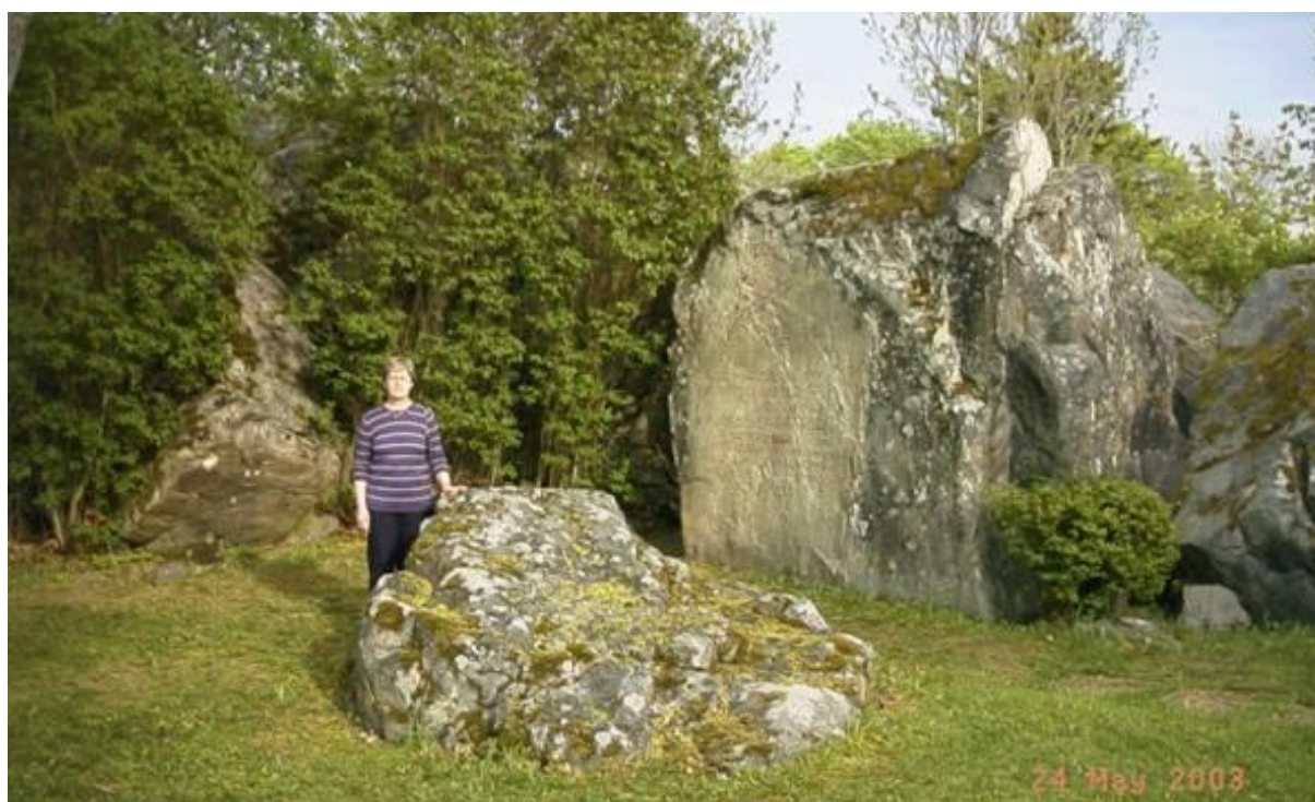
Platsens utseende år 2003