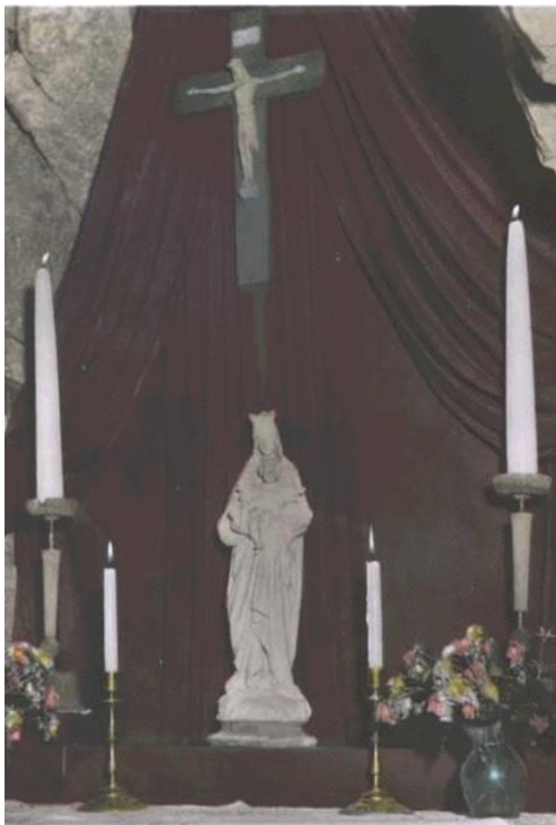
Vykort "Interiör av Birgitta-grottan, Finsta". Elliord Mattsson 1930 – talet.

Framför ett rött draperi på rummets södra vägg står ett altare med en Mariabild och på väggarna talrika konsoler med små statyetter, dekorerade vaxljus, ljusbärande putti, lampetter gjorda av paradplåtar till kaskar, blomstervaser m. m.