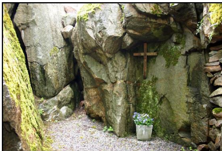
”den heliga Birgittas bönegrotta”

Styrelsen beslutade tydligen i enlighet med arbetsutskottets förslag eftersom ”grottan” sedan 1950-talet haft ett utseende enligt Pater Ferrys önskemål.