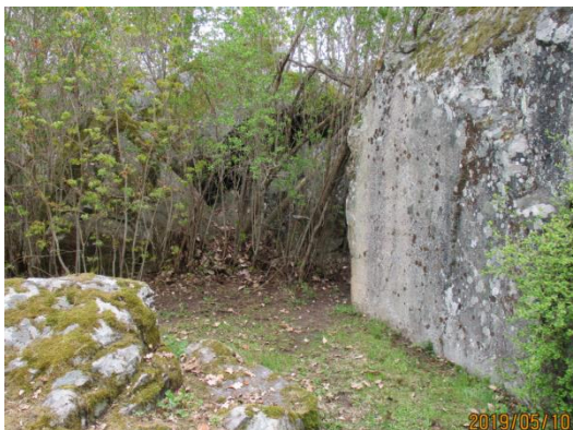
Blocket med minnesinskriftionen

På ett stort stenblock i parken vid Finsta gård finns en inskription till minne av denna tid. Blocket ligger alldeles intill den skreva varifrån Birgittas ursprungliga grotta kan nås.